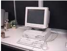
デスクトップ型パソコン